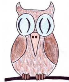
Zeichnung: Lukas Järvinen 3a, NMS Rum

Du bist Mitglied des Redaktionsteams der Jugendzeitschrift Jung-österreich und für die Beantwortung von Leseranfragen aus dem naturwissenschaftlichen Bereich an Dr. Euler zuständig. Dieses Mal ist eine besonders interessante Frage bei euch in der Redaktion eingetroffen.